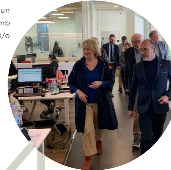
Visita del Conseller de Drets Socials de la Generalitat de Catalunya.