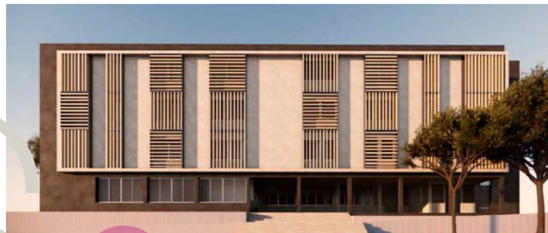
Grup SOM VIA. Complex Assistencial Maria Auxiliadora. Carrer Natzarret 119-129, 08035 Barcelona

Aquest entorn, a més de l'amplitud del Complex i possibilitats, el converteixen en un espai apropiat per mantenir els vincles familiars i la integració comunitària més favorable davant la fragilitat dels seus usuaris.