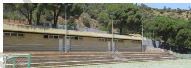
Ubicació, amplitud i entorn privilegiat en el març del parc natural de Collserola.